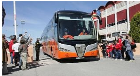
El autobús del Valencia, en una imagen de archivo, en la Ciudad Deportiva.

La novedad radica en que los abonados que lo deseen podrán hacerse con un paquete válido para los tres partidos por un precio de 30 euros para tribuna y 10 euros para el Gol Gran. La horquilla de precios para los no abonados va de los 15 a los 35 euros de la entrada más cara.